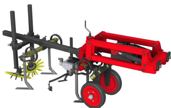
Unità parallelogramma K.U.L.T.iScan

La diminuzione del numero di principi attivi erbicidi disponibili, per la coltivazione convenzionale della barbabietola, così come le esigenze sociali e politiche, che si concentrano su metodi alternativi di controllo delle infestanti, rendono il sistema di diserbo K.U.L.T.iScan una soluzione interessante a tutti i livelli.